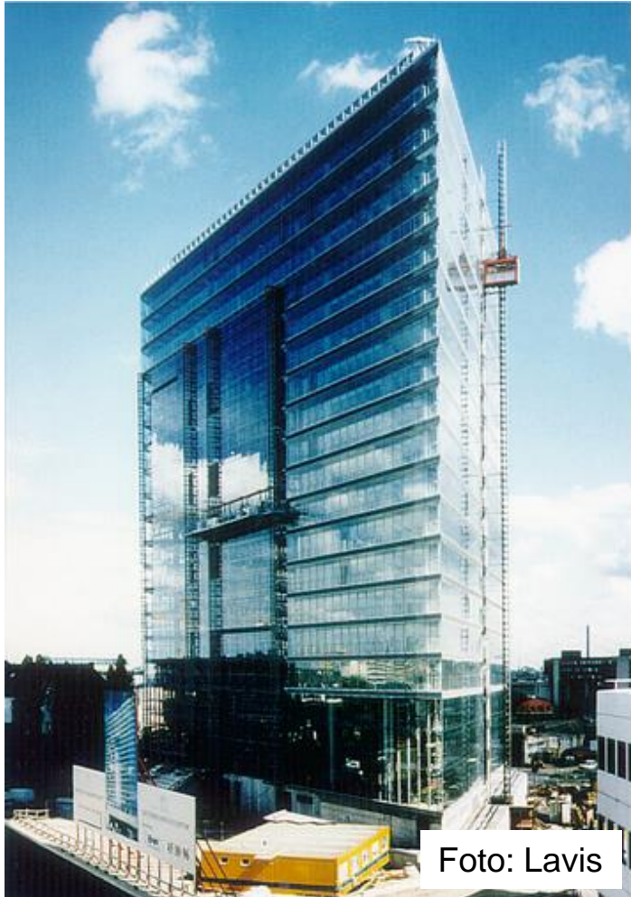
» Das Düsseldorfer Stadttor