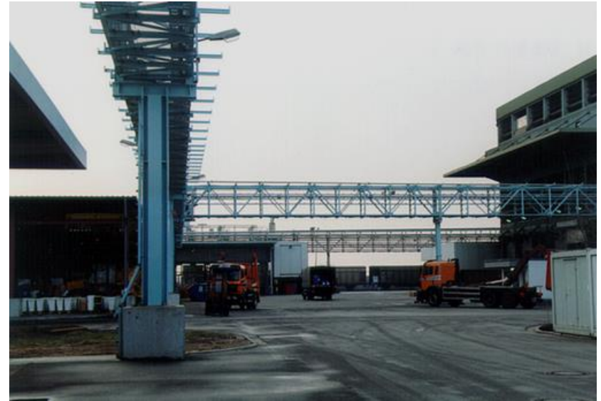
» Rohrbrücke, Biebesheim