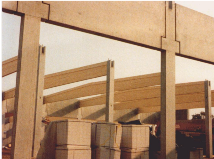
» Großbäckerei mit Holzleimbindern, Berlin