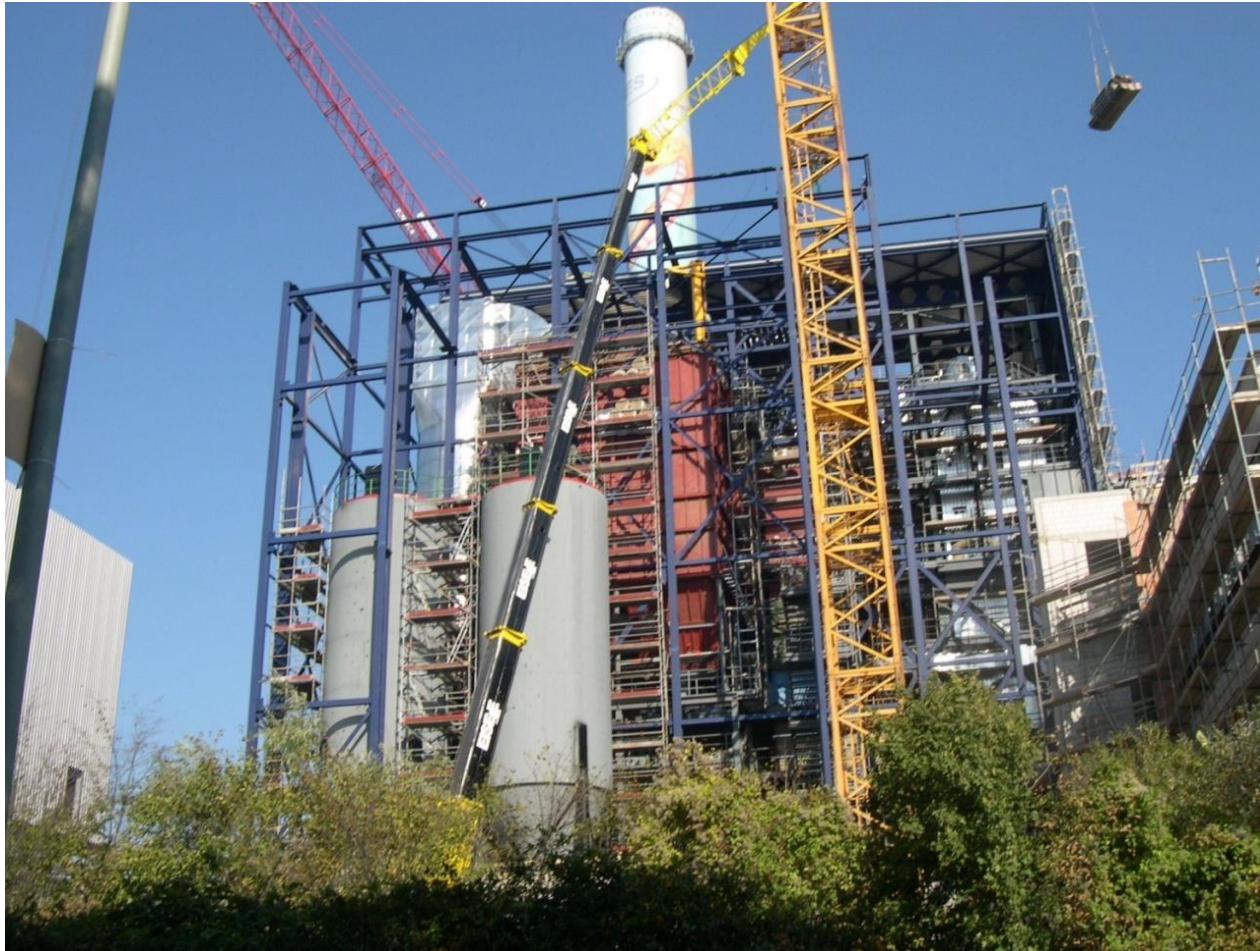
» Mühlheizkraftwerk Frankfurt