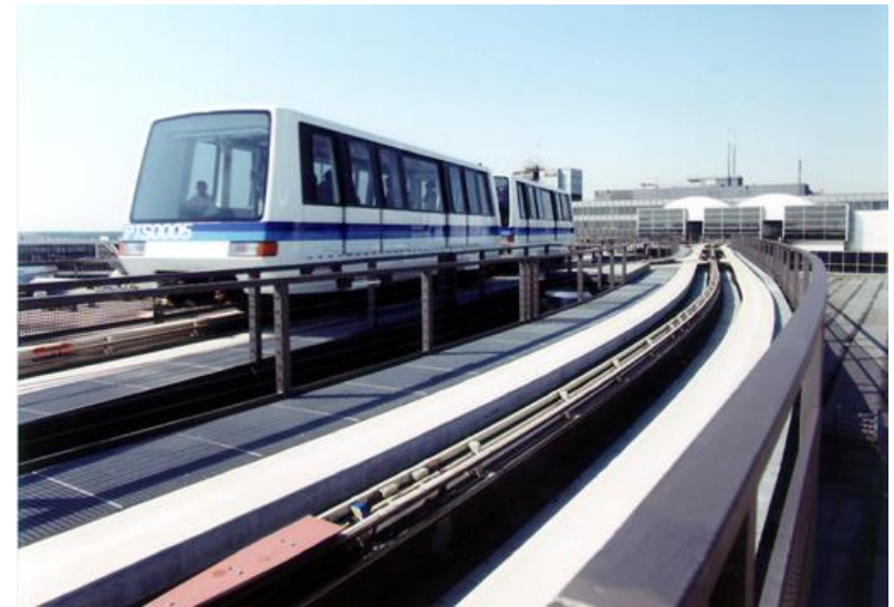
» Passagier Transfer System „PTS“ Frankfurter Flughafen