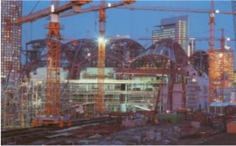
» Messehalle 3 in Frankfurt am Main