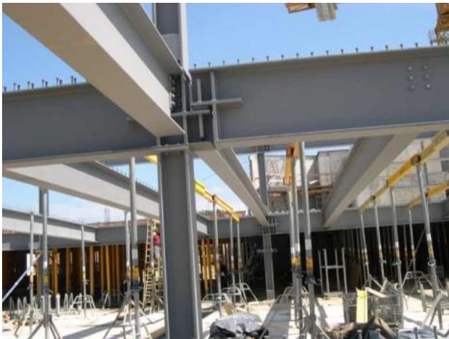
» Limbeckerplatz Essen