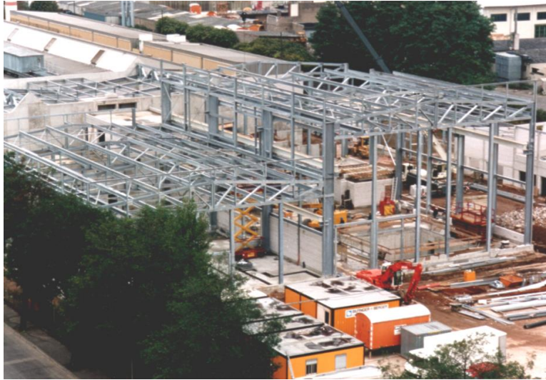
» Neubau Rascherstarrung, Vacuumschmelze Hanau