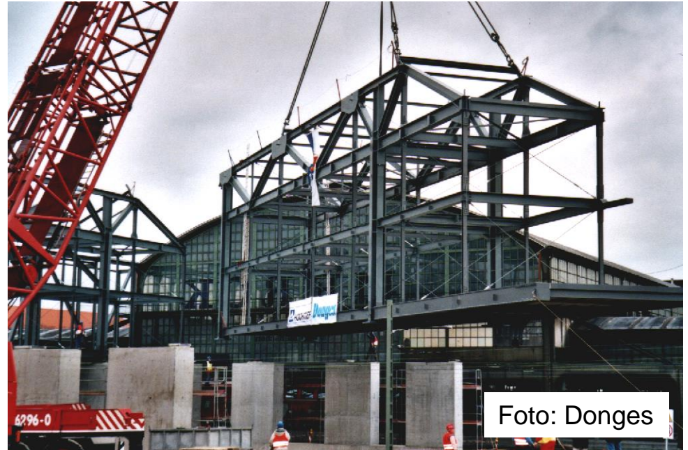
» Querbahnsteig Hauptbahnhof Darmstadt