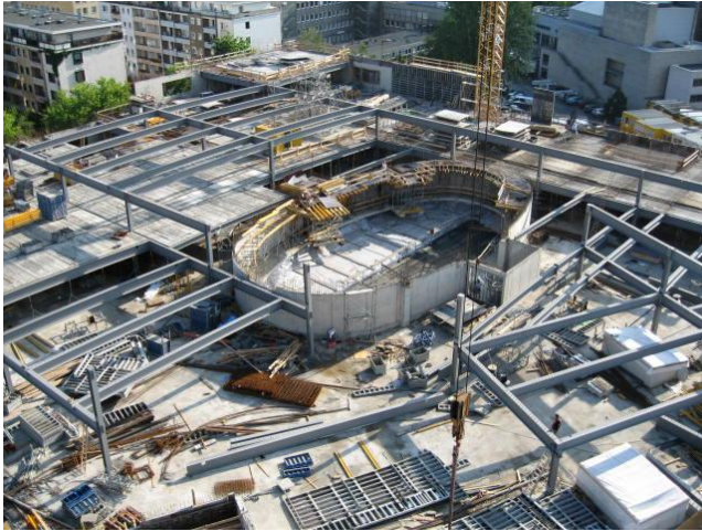
» Schlossgalerie Braunschweig