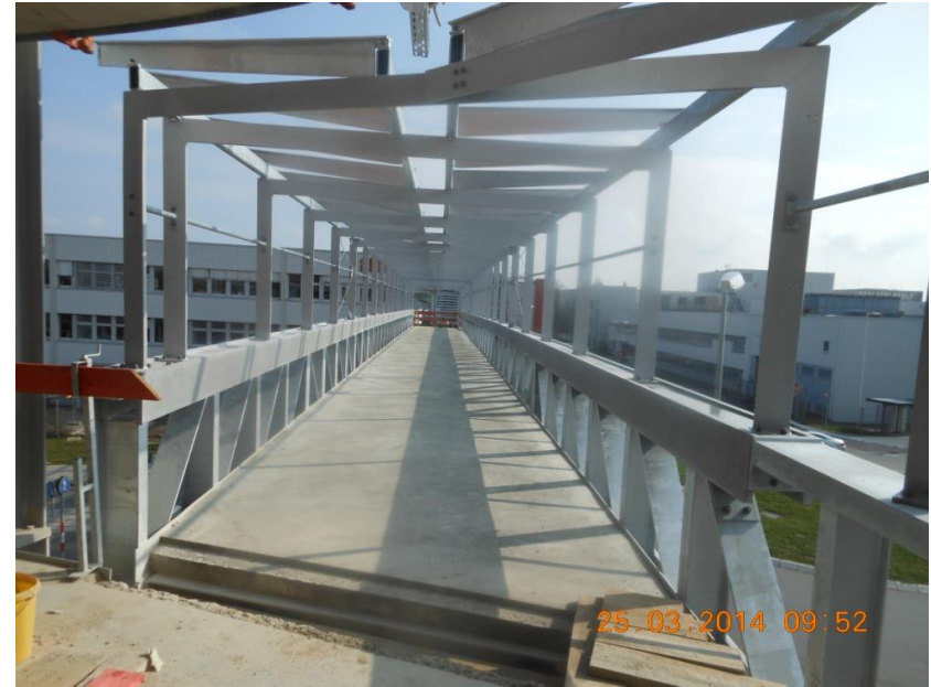
» Verbindungsbrücke Parkhaus SEW Bruchsal