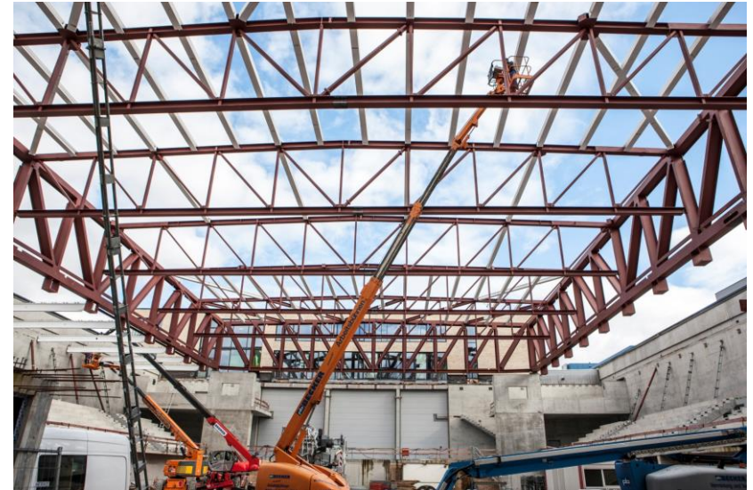
» Dachkonstruktion Hilda Gymnasium Pforzheim